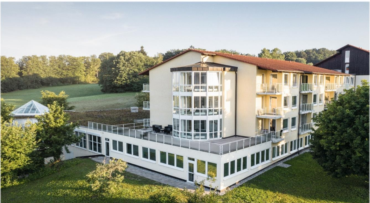
Oberberg Fachklinik Rhein-Jura.

Gelegen in einer der schönsten Regionen Europas ist die Oberberg Fachklinik Rhein-Jura eine private Akutklinik für Psychiatrie, Psychosomatik und Psychotherapie. Sie verfügt nicht nur über eine ärztliche Behandlung auf höchstem Niveau, sondern ist auch ein Ort, der Raum zu Selbstbesinnung, Neuorientierung und zur Heilung bietet. Das allgemeine Behandlungskonzept der Oberberg Kliniken basiert auf einem ganzheitlichen Menschenbild. Bei der Diagnostik werden neben den körperlichen und seelischen Symptomen auch die gesamte Person mit ihrer Biografie, ihrer Persönlichkeit und ihrem sozialen Umfeld betrachtet. Dabei wird stets auf dem neuesten Stand der Wissenschaft gearbeitet und in einer Atmosphäre, in der sich die Patienten wohl- und geborgen fühlen. Um bestmögliche Therapieergebnisse zu erreichen und den höchsten Qualitätsansprüchen gerecht zu werden, erfolgt die Behandlung der Patienten nach einem verbindlichen Prinzip: innovativ, intensiv und individuell.