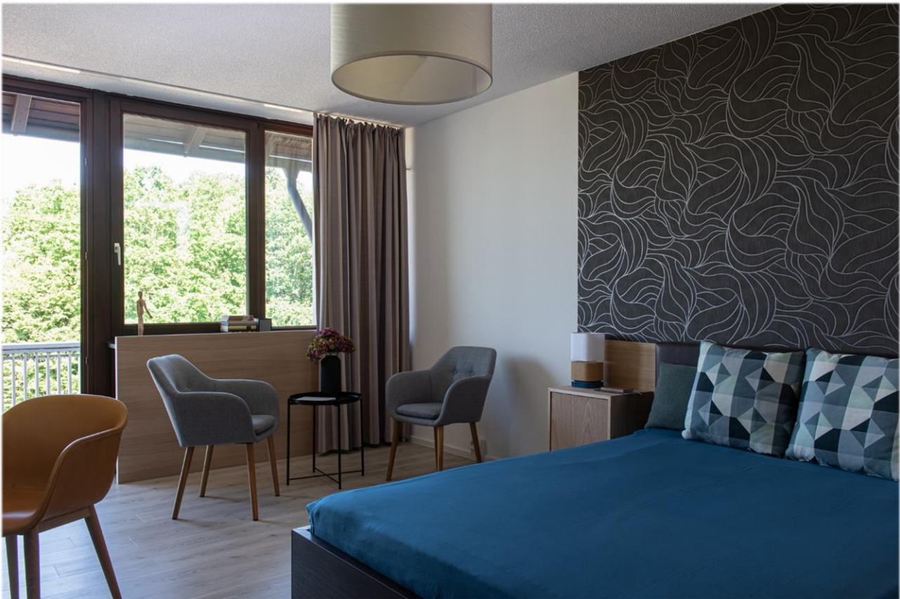
Patientenzimmer mit Wohlfühlatmosphäre.