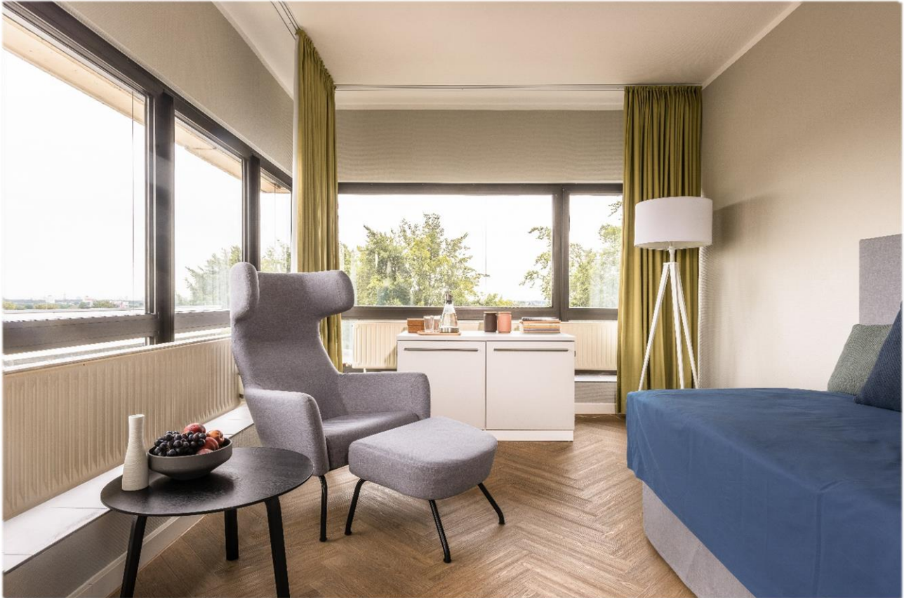
Patientenzimmer mit Wohlfühlatmosphäre.