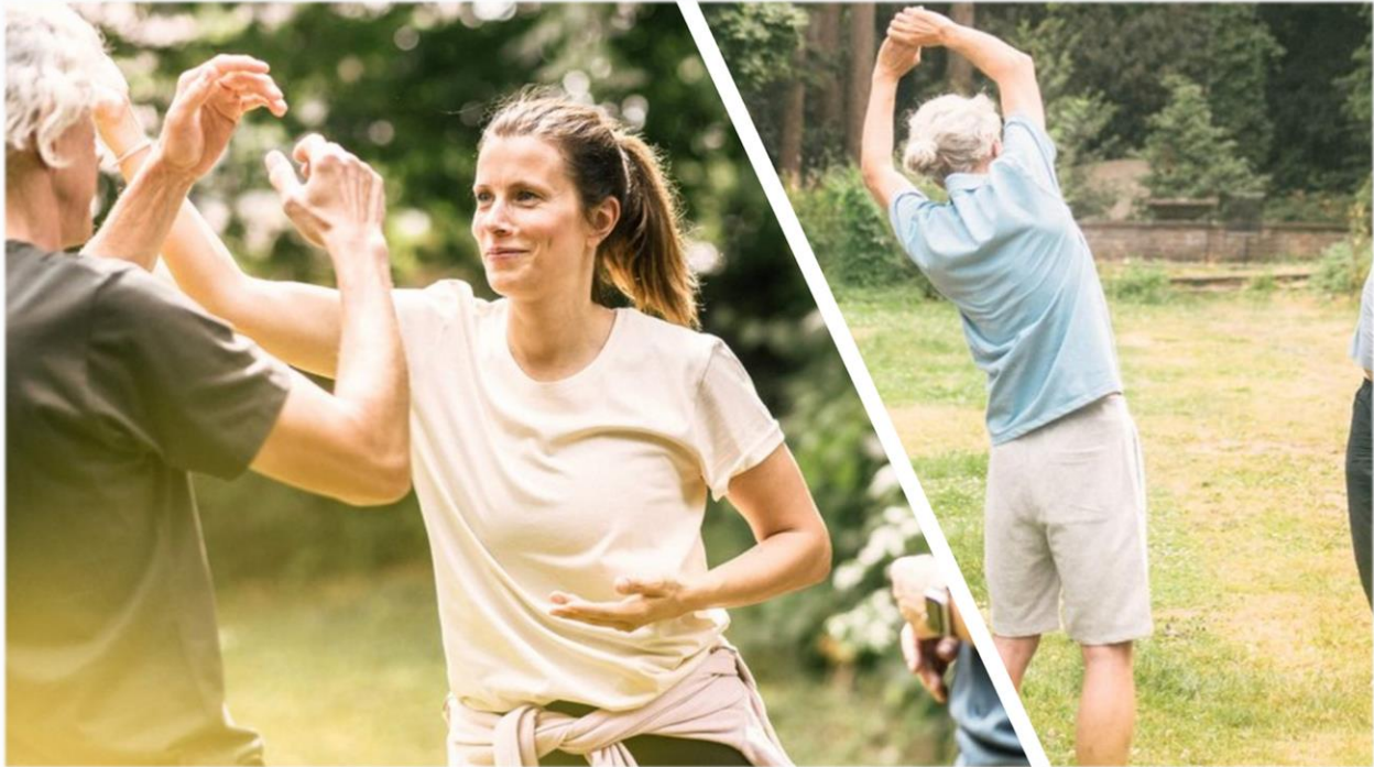
Sport und Bewegung sind ein wichtiges Element bei der Vorbeugung und Behandlung seelischer Störungen.

Die hohe Bedeutung von Sport und Bewegung in der Behandlung psychischer Erkrankungen ist mittlerweile wissenschaftlicher Konsens, allerdings werden diese Erkenntnisse in der Versorgungslandschaft wenig bzw. nur unsystematisch berücksichtigt. In der Oberberg Somnia Fachklinik Köln Hürth nimmt die Sport- und Bewegungstherapie einen besonderen Stellenwert ein, der sich in einem systematischen und breiten bewegungstherapeutischen Angebot ausdrückt. Ergänzend bietet die Klinik Geräte-, Kraft- und Ausdauertraining in einem kooperierenden Fitnessstudio an. Hier können die Patienten zusätzlich ihre Selbstsicherheit im Selbstverteidigungstraining Krav Maga optimieren.