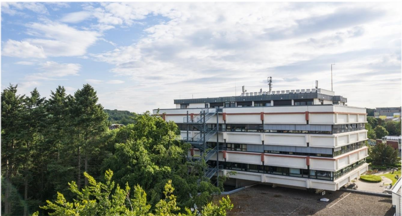
Oberberg Somnia Fachklinik Köln Hürth.

Die Oberberg Somnia Fachklinik Köln Hürth bietet eine große Bandbreite an medizinischen und psychotherapeutischen Leistungen für das gesamte Spektrum psychischer und psychosomatischer Erkrankungen. Die herzliche Aufnahme, das ansprechende Ambiente und die individuelle therapeutische Unterstützung helfen den Patienten auf ihrem Weg zu einer vollständigen und dauerhaften Heilung. Die zentrale Lage der Klinik mit diversen Rückzugsmöglichkeiten trägt sehr zu einem angenehmen Wohlfühlambiente bei. Das allgemeine Behandlungskonzept der Oberberg Kliniken basiert auf einem ganzheitlichen Menschenbild. Bei der Diagnostik werden neben den körperlichen und seelischen Symptomen auch die gesamte Person mit ihrer Biografie, ihrer Persönlichkeit und ihrem sozialen Umfeld betrachtet. Dabei wird stets auf dem neuesten Stand der Wissenschaft gearbeitet und in einer Atmosphäre, in der sich die Patienten wohl- und geborgen fühlen. Um bestmögliche Therapieergebnisse zu erreichen und den höchsten Qualitätsansprüchen gerecht zu werden, erfolgt die Behandlung der Patienten nach einem verbindlichen Prinzip: innovativ, intensiv und individuell.